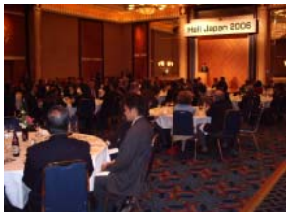
バンケットの風景