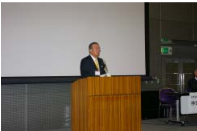
ヘリジャパン2006名誉議長 神田愛知県知事のご挨拶