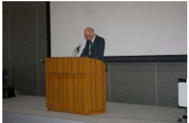
ヘリジャパン2006議長 長島知有名誉教授