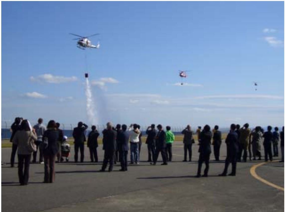
愛知、三重、名古屋航空隊の消火訓練デモ