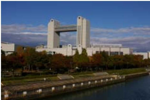
名古屋国際会議場