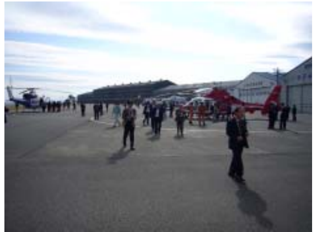
見学会（伊勢湾ヘリポート）